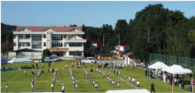
10月2日（土）晴天の下、2年ぶりに開催さ れた、油木保育所・油木小学校合同運動会

柏床Ⅱ各学校の取り組みに ついて、具体的にはどの様 な取り組みをされるのか。 教育課長Ⅱ実施内容は、各 学校で様々な取り組みが計 画・実施されているが、内 容については次のとおり。