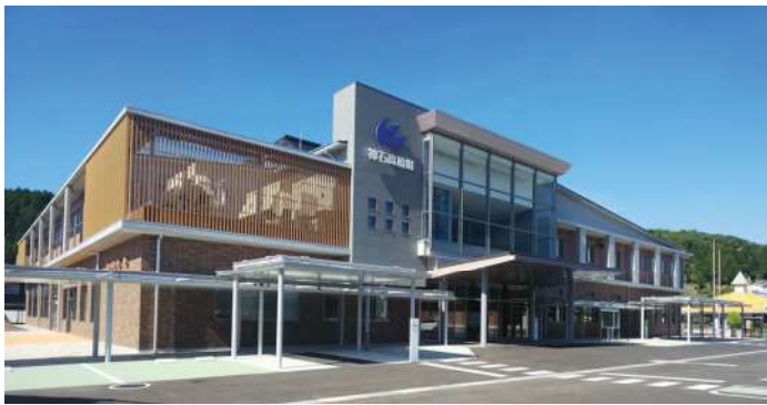
10月14日に開庁した役場新庁舎

町長Ⅱどういう形でできるか、学校にも負担がかわらないように検討し、実施できるものはしていきたい。柏床Ⅱ教育委員会にお願いしたい。議事録も取られているので、この次世代議会の提案の取り組みなどを残して後輩たちの参考にしていただきたい。