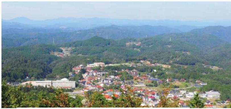
権現山山頂から油木の街並み 10月4日撮影